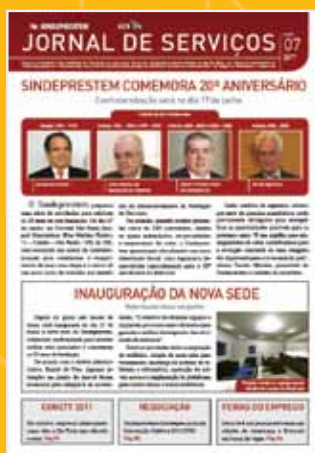
Jornal de Serviços

O SINDEPRESTEM desenvolveu uma gama de Benefícios especiais para as Empresas Associadas, Filiadas e Sindicalizadas.